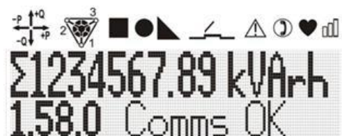
Slika 1: Prikaz pokaznika

Pristup pokazniku imaju krajnji korisnik i osoba zadužena za održavanje, gdje osoba zadužena za održavanje ima omogućen pristup svim funkcijama, dok je pristup krajnjeg korisnika ograničen.