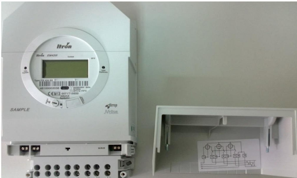
Slika 5.: Fotografija brojila ITRON EM420i 424 G1 s označenim mjestom plombe sa državnim oznakama za ovjeravanje i zaštitu u obliku žiga za utiskivanje